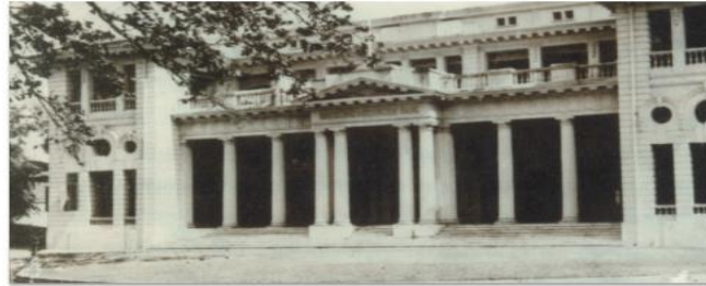
การจัดตั้งและการดำเนินการในช่วงแรกของธนาคารแห่งประเทศไทย