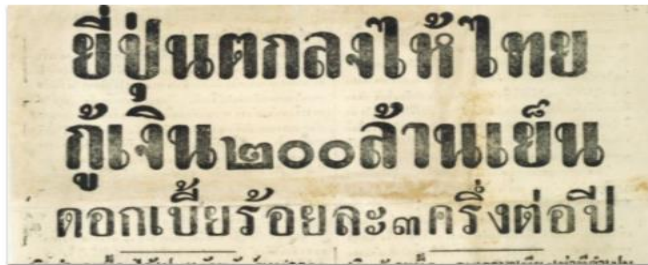
ปัญหาเงินเพื่อช่วงสงครามโลกครั้งที่สอง