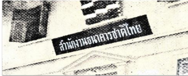
ความเป็นมาของสำนักงานธนาคารชาติไทย