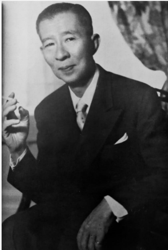
พระวรวงศ์เธอ พระองค์เจ้าวิวัฒนไชย ผู้ว่าการธนาคารแห่งประเทศไทยพระองค์แรก