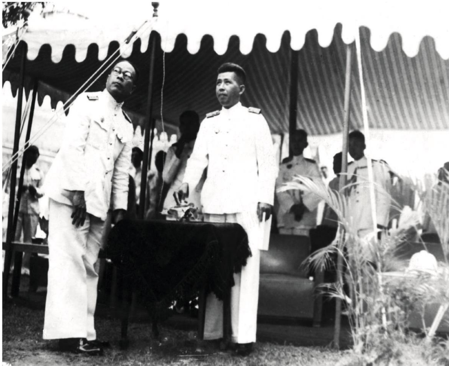
หลวงประดิษฐมนูธรรม รัฐมนตรีว่าการกระทรวงการคลัง เป็นประธานในพิธีเปิดสำนักงานธนาคารชาติไทย