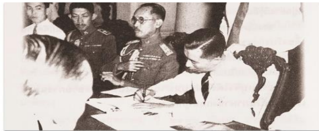
ภาวะเศรษฐกิจการเงินภายหลังสงครามโลกครั้งที่สอง