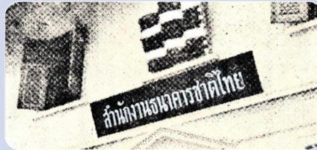
สำนักงาน ธนาคารชาติไทย (1940)