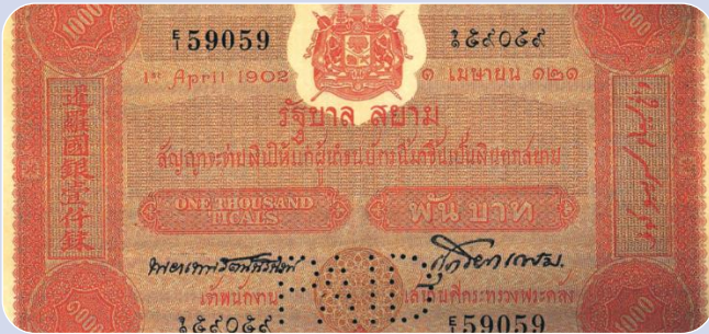
ธนบัตรไทย (1902) “Book club” (1904)