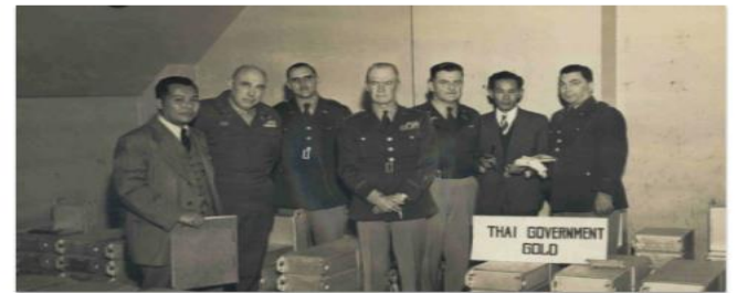
การบูรณะระบบการเงินภายหลังสงครามโลกครั้งที่สอง