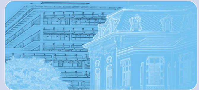
ธนาคารแห่ง ประเทศไทย (1942)