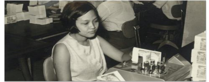
ปัญหารณบัตรราคาแลกเปลี่ยนช่วงสงครามโลกครั้งที่สอง