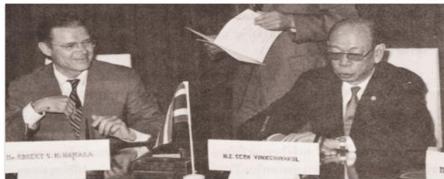
ปัญหาการขาดเสถียรภาพทางการคลังและการขาดดุลการค้าในช่วงทศวรรษ 2490