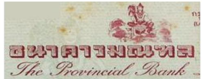
วิกฤตการณ์ช่วงต้นของธนาคารพาณิชย์ไทย