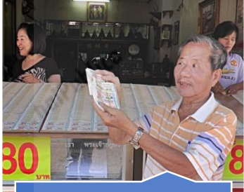
ปรับสัดส่วนราคา สลากฯ