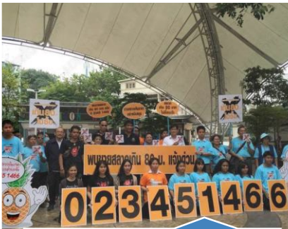
การตั้งศูนย์ร้องเรียน ตลอด 24 ชั่วโมง