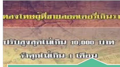
กำหนดอัตราโทษผู้ขายเกิน ราคา จำคุกไม่เกิน 1 เดือน หรือปรับไม่เกิน 10,000 บาท