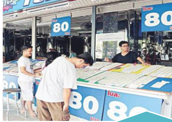
บังคับใช้กฎหมายให้ขายสลากไม่เกินคู่ ละ 80 บาท ทั่วประเทศ ตั้งแต่วันที่ 16 มิถุนายน 2558 เป็นต้นมา