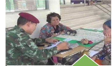
จัดชุดปฏิบัติการพิเศษ... ติดตาม ตรวจสอบ และ จับกุม