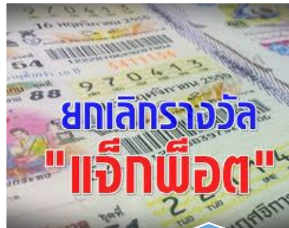
ยกเลิกรางวัลแจ็กพ็อต