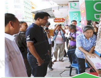
ลงพื้นที่ สร้างความเข้าใจ ทั่วประเทศ