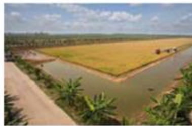
ศูนย์เรียนรู้ ข้าวปลาปาล์ม