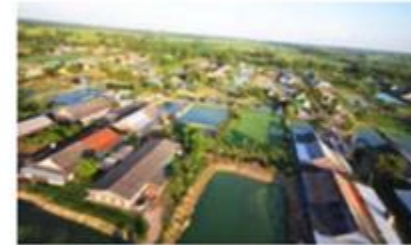
หมู่บ้านเกษตรกรรมท่าแพงเพชร