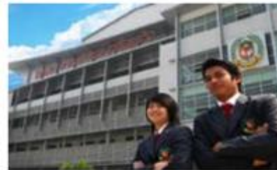
การศึกษาสร้างเยาวชน พัฒนาคณ