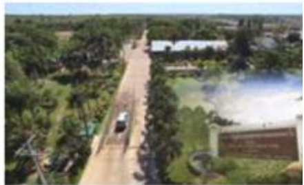
หมู่บ้านเกษตรกรรมหนองหว้า

การลงทุนในบริษัทเพื่อสังคม Social Startup