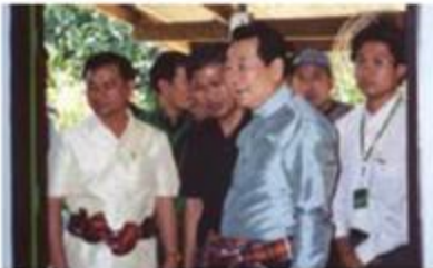
ส่งเสริม 7 อาชีพ 7 รายได้ ตามแนว พระราชดำริ