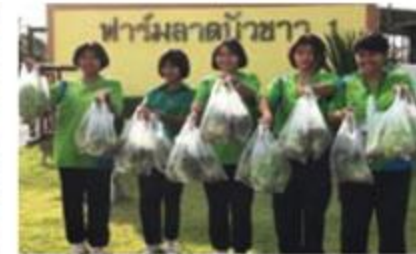
ซีพีเอฟ อัม | สุข | ปลูกอนาคต :