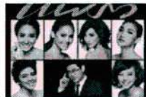
สรยุทธ คง 12 ขุดตารเมืองไทย ก่ายแบบ 'นิตยสารแพรว'