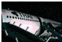
ขมดลปจากรันเวย์ หลังเครื่องบินการบินไทยไกล

ดังนั้นโจทก์ทั้งห้า จึงอาจใช้สิทธิฟ้องร้องคดีในเขตอำนาจศาลได้ทั่วราชอาณาจักรอีกด้วย