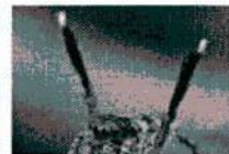
ไซรจากแมงมบนกตอง ระบาวาดสาว ออกสเด็ปขวนผสมหันธุ์