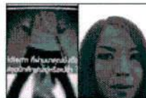
ศิลปินตัวจริงเสียงจริง "ฮิม เนโกะ" ไร่ขบวนแลนดี้ขุดนิกศึกษา