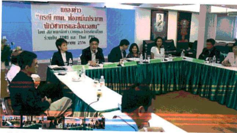
ส.นักข่าววิทยุและโทรทัศน์ ร่วมกับ TDRi และ TPBS ขึ้นแจ้ง กรณี กทค.ฟ้องหมิ่นประมาทนักวิชาการ-สื่อมวลชน

วันพฤหัสบดีที่ 5 กันยายน 2556 เวลา 13:08 น.