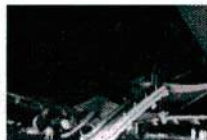
ขมสภาพเจ้าจามี่ หลังยางระเบิด